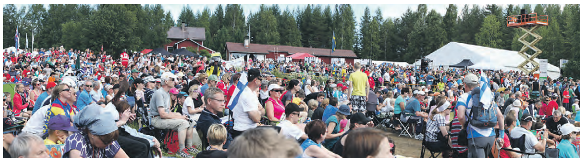
MM-kisahuumaa Tipasojan maisemista.

(He ovat hyvinä esimerkkeinä meidänkin nuorille suunnistajille, että mikäli luo itsellensä tavoitteita joihin myös uskoo, ja on valmis tekemään niiden eteen kovasti töitä, mikä tahansa on tulevaisuudessa mahdollista. Joten Raskun nuoret, yritystä ja tavoitteita harjoitteluun kohti tulevia suunnistuskausia!)