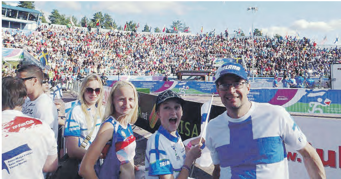
MM-sprintin raskulaisia tunnelmia.